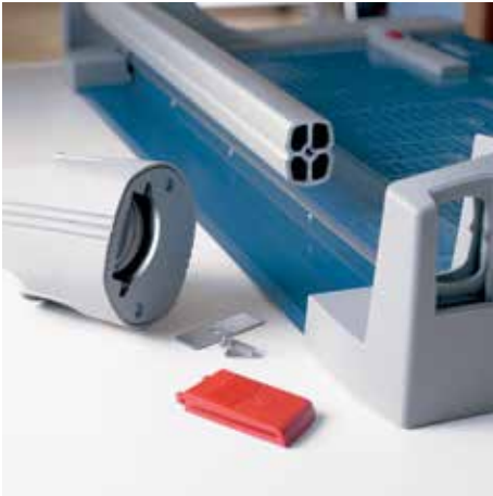
Einfacher Messerkopfwechsel sorgt für reibungslose Arbeitsabläufe