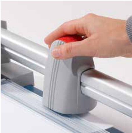
Ergonomischer Schneidekopf für eine komfortable Bedienung der Schneidemaschine