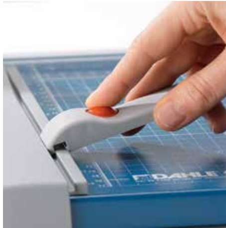
Verstellbarer Rückanschlag zur schnellen Formatfindung - auf beiden Winkelanlagen einsetzbar